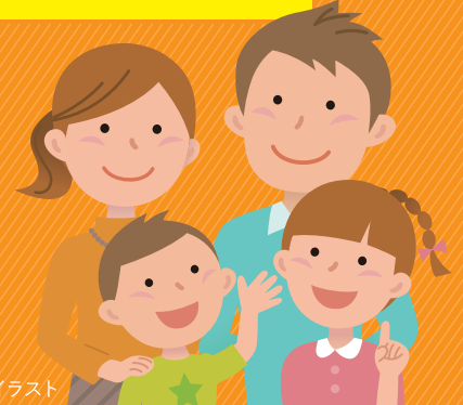
イメージイラスト

こどもみらい住宅支援事業は、子育て支援及び2050年カーボンニュートラルの実現の観点から、子育て世帯や若者夫婦世帯による高い省エネ性能を有する新築住宅の取得や住宅の省エネ改修等に対して補助することにより、子育て世帯や若者夫婦世帯の住宅取得に伴う負担軽減を図るとともに、省エネ性能を有する住宅ストックの形成を図る事業です。